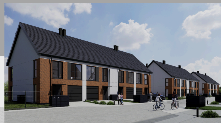
Widok od strony ulicy