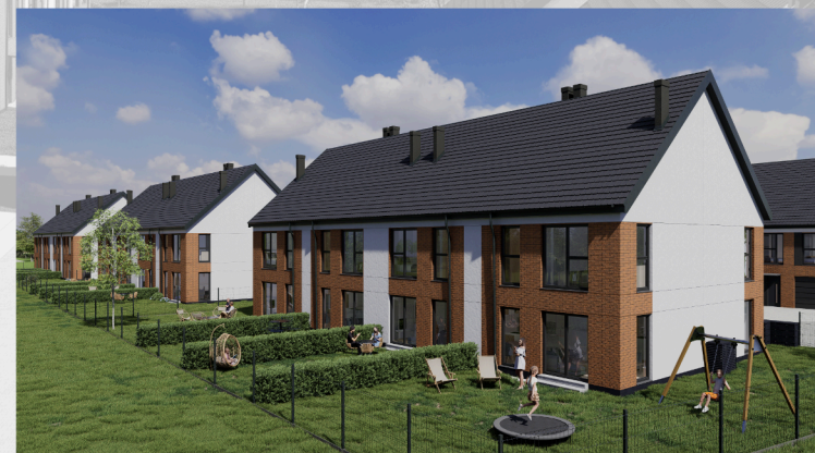
Widok od strony ogrodu