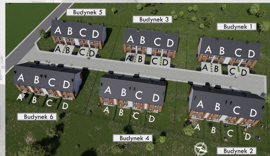
Widok osiedla z lotu ptaka