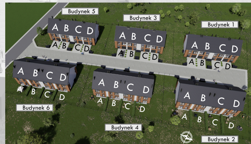
Widok osiedla z lotu ptaka

Karta katalogowa opracowana na podstawie projektu budowlanego. W lokalach/ogrodach/podjazdach mogą wystąpić zmiany wprowadzone na etapie projektu wykonawczego. Wymiary i powierzchnie są liczone według rozporządzenia Ministra Rozwoju z dnia 11 września 2020r. w sprawie szczegółowego zakresu i formy projektu budowlanego, zgodnie z zasadami zawartymi w polskiej normie PN-ISO 9836:2022-07. Ostateczna powierzchnia zostanie obliczona na podstawie pomiaru powykonawczego, zgodnie z powyżej wymienioną normą. Aranżacja mieszkania (tj. drzwi wewnętrzne, meble, sprzęt AGD i RTV) ma charakter poglądowy i nie stanowi wyposażenia lokalu w standardzie oferowanym do sprzedaży. Pomiarów pod zakup mebli, urządzeń i wyposażenia należy dokonać z natury, po zakończeniu realizacji.